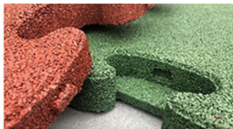
2. Specjalne zamki