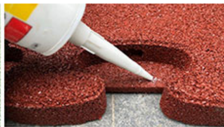
3. Dno wypustów (klejenie puzzli do siebie)

Łączenie na zamki i klejenie puzzli do siebie pozwala uzyskać zalety zarówno nawierzchni składających się z elementów jak i wylewanych: z jednej strony istnieje możliwość wymiany poszczególnych elementów lub nawet ich demontażu w razie potrzeby, a z drugiej strony (po wykonaniu klejenia) mamy do czynienia z jednorodną, spójną nawierzchnią! Co bardzo istotne – nawierzchnię Flexi-Step Puzzle 3D można układać bezpośrednio na wyrównanym i stabilnym gruncie, bez konieczności stosowania podbudowy, co pozwala na znaczne oszczędności kosztów!