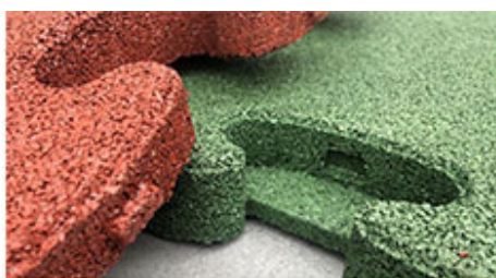
2. Specjalne zamki