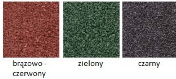
Rys. 2. Dostępna kolorystyka