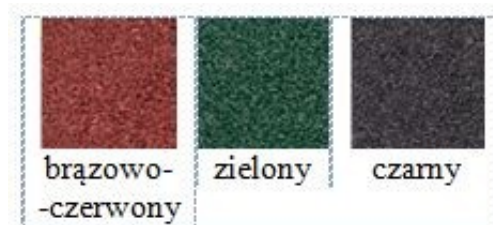
Rys. 4. Dostępna kolorystyka