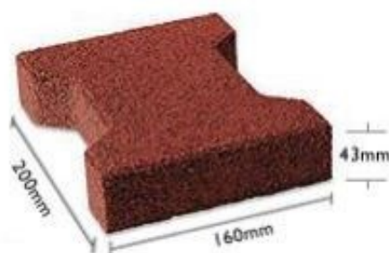
Rys. 1. Wymiary urządzenia