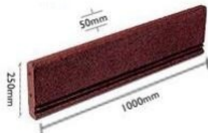
Zał. 1 Wymiary urządzenia