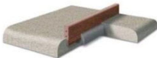
Rys. 2. Sposób mocowania urządzenia