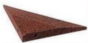
Rys. 2. Osłona