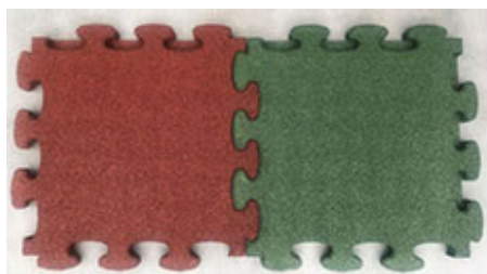
1. Tradycyjny kształt puzzla (12 wypustek)