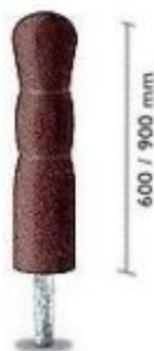
Rys. 1. Wymiary urządzenia