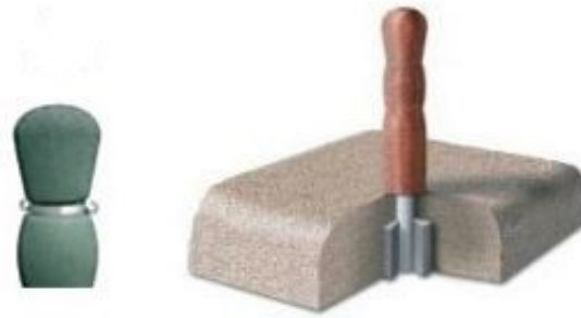
Rys. 2. Sposób mocowania