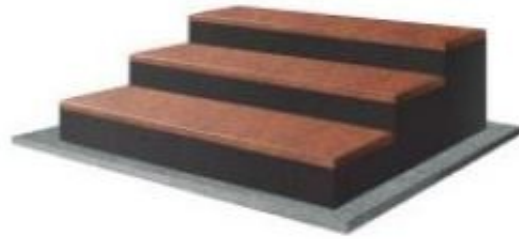
Rys. 3. Sposób mocowania