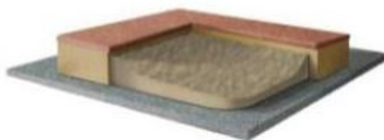
Rys. 2. Sposób mocowania