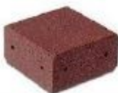
Rys. 2. Narożnik 300x300x150mm