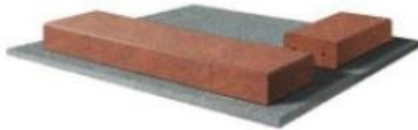
Rys. 4. Sposób mocowania