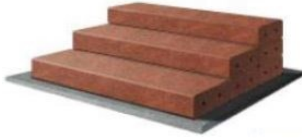
Rys. 3. Sposób mocowania