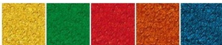
Rys. 4. Dostępna kolorystyka EPDM