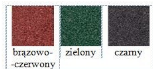
Rys. 2. Dostępna kolorystyka