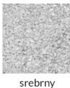
Rys. 3. Dostępna kolorystyka PROTECT